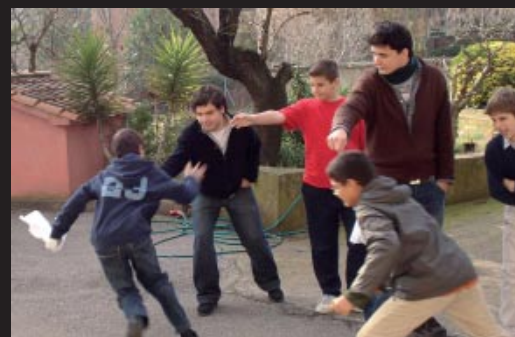
Grup d'infants Amics de Jesús