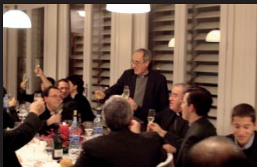
Sopar de Nadal