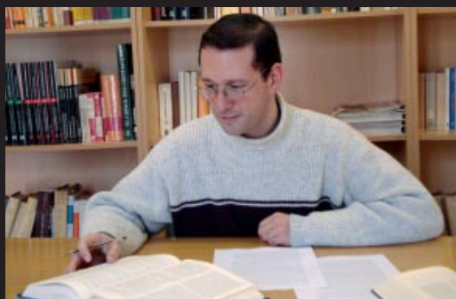
Els exàmens del primer semestre