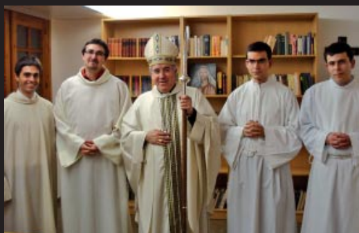
Ministeris de lector i acòlit