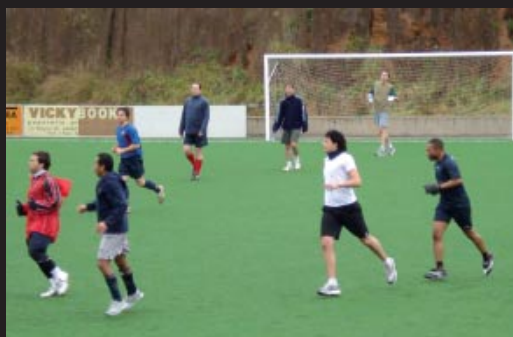
Partit de futbol mossens-seminaristes