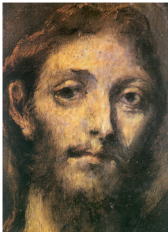
Faç del Crist ressuscitat. Pintura del Greco. Museu del Prado. Madrid

Al saltar a tierra, ven unas brasas con un pescado puesto encima y pan. Jesús les dice: «Traed de los peces que acabáis de coger.» Simón Pedro subió a la barca y arrastró hasta la orilla la red repleta de peces grandes: ciento cincuenta y tres. Y aunque eran tantos, no se rompió la red. Jesús les dice: «Vamos, almorzad.» Ninguno de los discípulos se atrevía a preguntarle quién era, porque sabían bien que era el Señor. Jesús se acerca, toma el pan y se lo da, y lo mismo el pescado. Esta fue la tercera vez que Jesús se apareció a los discípulos, después de resucitar de entre los muertos.