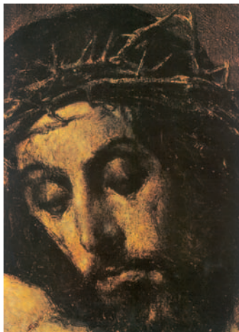
Faç del Crist crucificat (fragment). Pintura del Greco.

Los discípulos quedaron llenos de alegría y de Espíritu Santo.