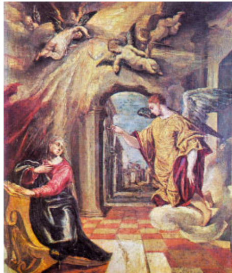
L'Anunciació a Maria. Pintura del Greco (Museu del Prado, Madrid)

Ell em dirà: «Sou el meu pare, / el meu Déu i la roca que em salva.» / Mantindrè per sempre el meu amor, / la meua aliança amb ell serà perpètua. R.