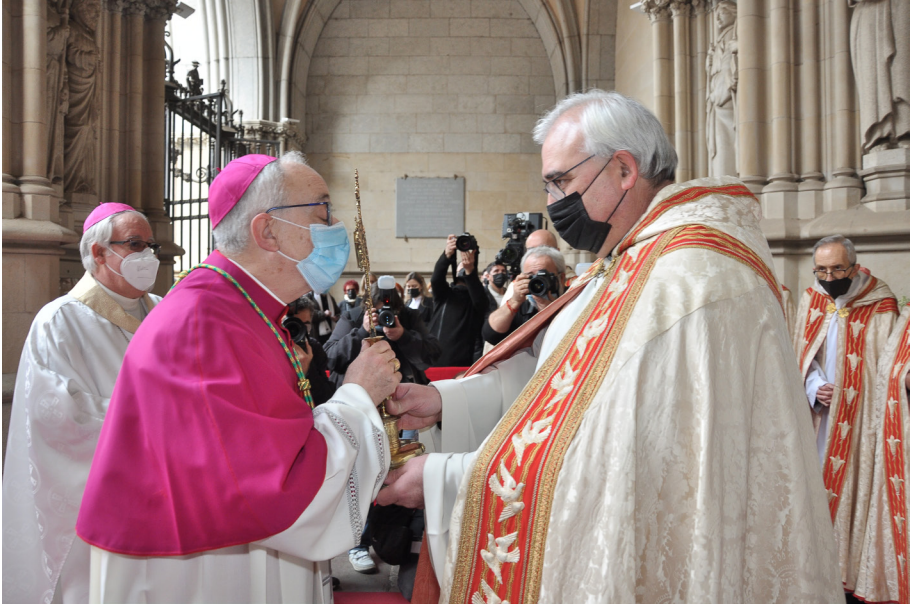
Entrada de Mons. Salvador Cristau a la Catedral de Terrassa.