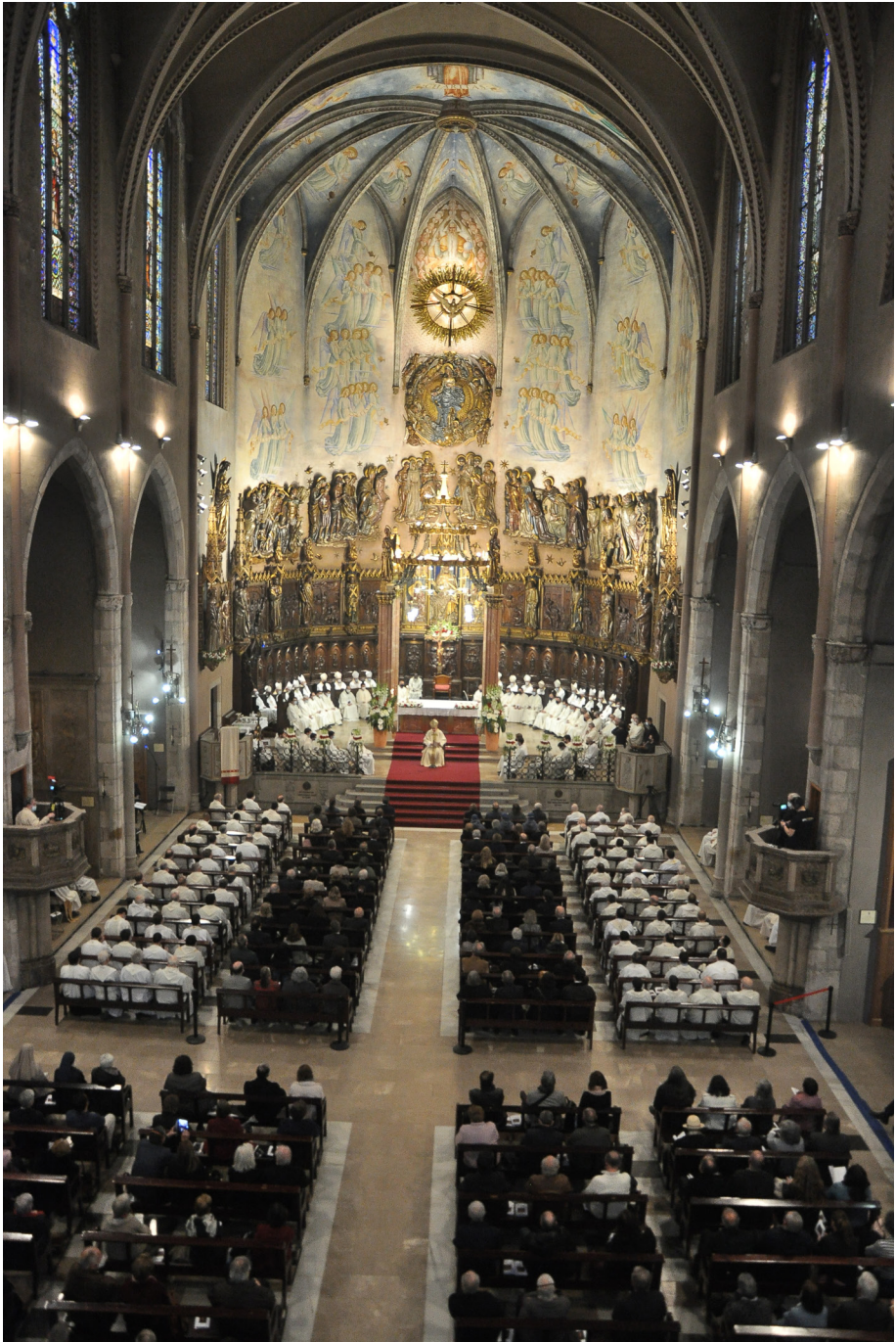
Vista panoràmica de la Catedral durant la presa de possessió.