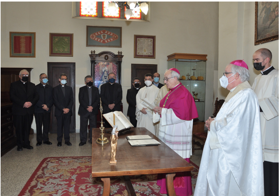
Moment del jurament de fidelitat i acceptació.