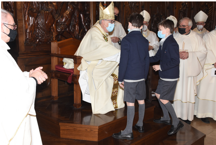
Salutació del poble de Déu.