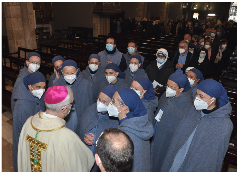
Imatges de salutació als fidels al final de la celebració.