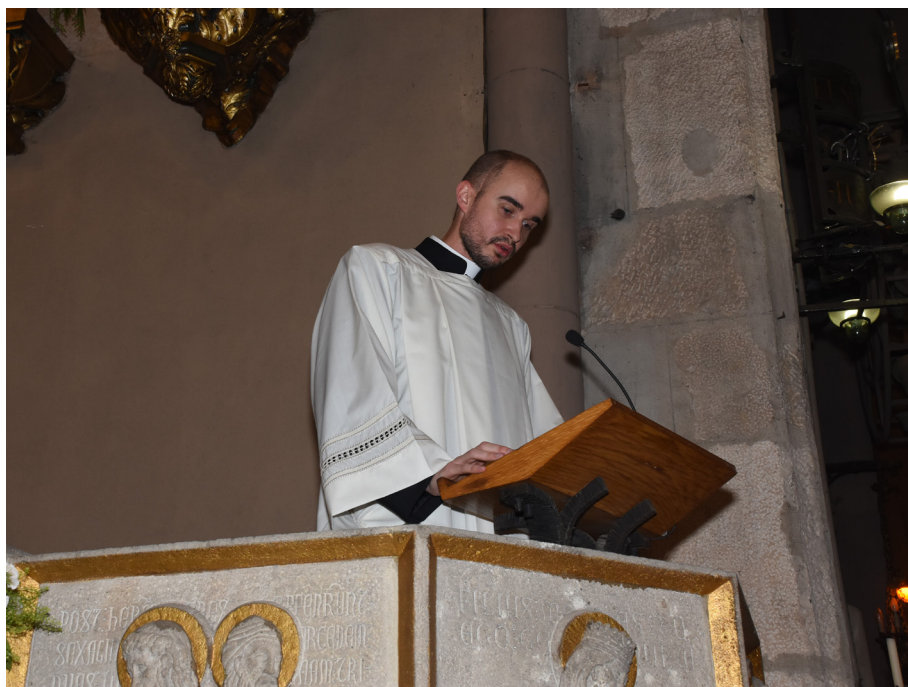
Lectura de les lletres apostòliques amb el nomenament.