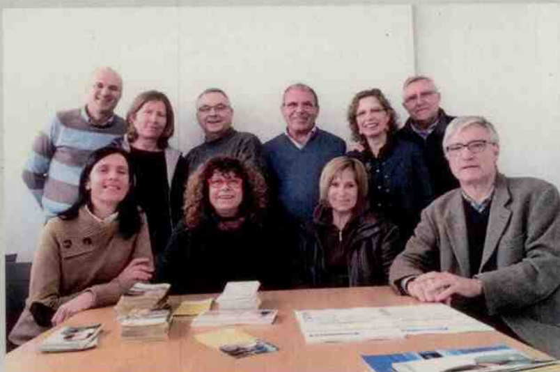
Grup de voluntaris del COF Terrassa.

Altres telèfons de contacte són el del Grup d'Educació Afectiva i Sexual, 649 935 317, i cursos per al reconeixement de la fertilitat de la parella per mitjà del mètode d'ovulació Billings, 620 480 606.