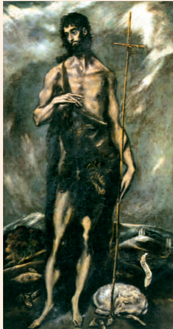
Sant Joan Baptista. Pintura d'El Greco, Museu Provincial de València

Y proclamaba: «Detrás de mí viene el que puede más que yo, y yo no merezco agacharme para desatarle las sandalias. Yo os he bautizado con agua, pero él os bautizará con Espíritu Santo.»