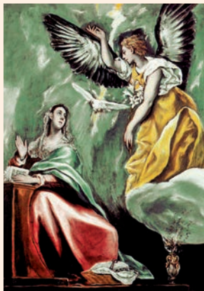
Anunciació, d'El Greco. Museu de Belles Arts de Budapest

En aquel tiempo, el ángel Gabriel fue enviado por Dios a una ciudad de Galilea llamada Nazaret, a una virgen desposada con un hombre llamado José, de la estirpe de David; la virgen se llamaba María. El ángel, entrando en su presencia, dijo: «Alégrate, llena de gracia, el Señor está contigo.» Ella se turbó ante estas palabras y se preguntaba qué saludo era aquél. El ángel le dijo: «No temas, María, porque has encontrado gracia ante Dios. Concebirás en tu vientre y darás a luz un hijo, y le pondrás por nombre Jesús. Será grande, se llamará Hijo del Altísimo, el Señor Dios le dará el trono de David, su padre, reinará sobre la casa de Jacob para siempre, y su reino no tendrá fin.» Y María dijo al ángel: «¿Cómo será eso, pues no conozco a varón?» El ángel le contestó: «El Espíritu Santo vendrá sobre ti, y la fuerza del Altísimo te cubrirá con su sombra; por eso el Santo que va a nacer se llamará Hijo de Dios. Ahí tienes a tu pariente Isabel, que, a pesar de su vejez, ha concebido un hijo, y ya está de seis meses la que llamaban estéril, porque para Dios nada hay imposible.» María contestó: «Aquí está la esclava del Señor; hágase en mí según tu palabra.» Y la dejó el ángel.