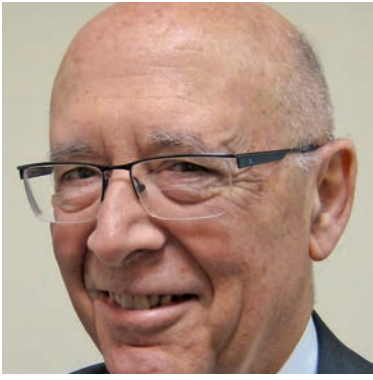
Aquesta imatge parla