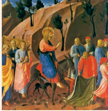
Entrada de Jesús a Jerusalem. Pintura del beat Fra Angélic, Convent de Sant Marc (Florència)

Contaré tu fama a mis hermanos, / en medio de la asamblea te alabaré. / Fieles del Señor, alabadlo; / linaje de Jacob, glorificadlo; / temedlo, linaje de Israel. R.