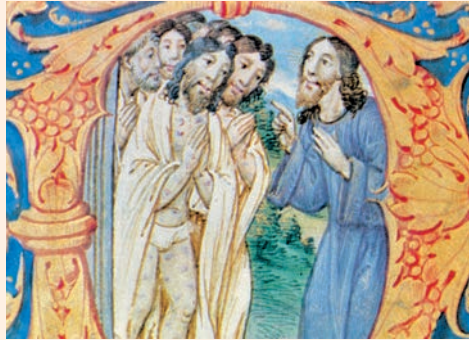
Jesús i els leprosos. Miniatura del Missal del cardenal Cisneros, Biblioteca Nacional (Madrid)

Naamán dijo: «Entonces, que entreguen a tu servidor una carga de tierra, que pueda llevar un par de mulas; porque en adelante tu servidor no ofrecerá holocaustos ni sacrificios de comunión a otros dioses fuera del Señor.»