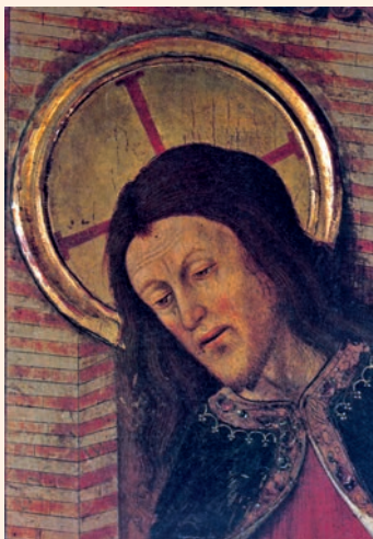
La faç de Jesucrist. Fragment del retaule del Salvador, de Bernat Martorell (any 1449), sobre la conversa de Jesús amb la dona samaritana (Catedral de Barcelona)

«Fijaos en lo que dice el juez injusto; pues Dios, ¿no hará justicia a sus elegidos que le gritan día y noche?; ¿o les dará largas? Os digo que les hará justicia sin tardar. Pero, cuando venga el Hijo del hombre, ¿encontrará esta fe en la tierra?»