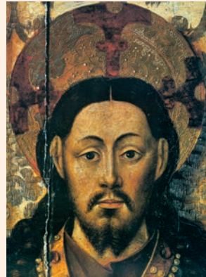
Faç de Crist, del retaule La Santa Cena , procedent de l'antiga Cartoixa de Caldecristo (Museu de la Catedral de Sogorb)

Ningún siervo puede servir a dos amos: porque o bien aborrecerá a uno y amará al otro, o bien se dedicará al primero y no hará caso del segundo. No podéis servir a Dios y al dinero.»