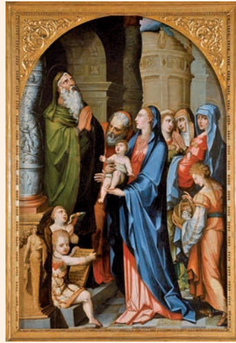
La Purificació, pintura de Luis de Vargas (1505-1567). Museu de Belles Arts de Sevilla

Y cuando cumplieron todo lo que prescribía la ley del Señor, se volvieron a Galilea, a su ciudad de Nazaret. El niño iba creciendo y robusteciéndose, y se llenaba de sabiduría; y la gracia de Dios lo acompañaba.