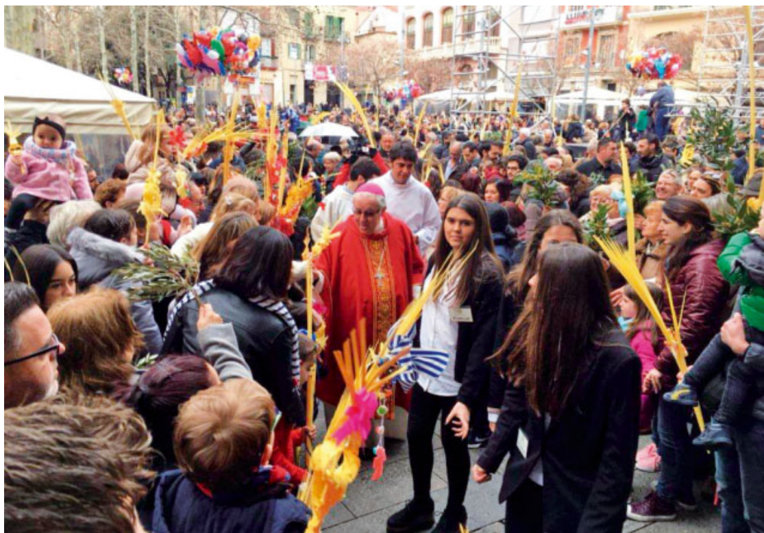
Diumenge de Rams 2018

Un any més, celebrem el Diumenge de Rams. Com aquella multitud de deixebles que es varen entusiasmar el primer Diumenge de Rams, també nosaltres en aquest dia proclamem amb entusiasme: «¡Beneït el qui ve en nom del Senyor!». Aclamem Jesús, que és el Mestre, el Salvador, el centre de la vida, de la història, la Vida que dona sentit a la nostra vida. En ell s'han acomplert les Escriptures i ha començat el temps de la salvació. Amb ell ha arribat el temps de gràcia per als pobres, els captius, els oprimits. Ell ha vingut a alliberar-nos de la ceguesa del cos i de l'esperit, de la pobresa i l'esclavitud, ell ve a alliberar del pecat. És l'Ungit de Déu per l'Esperit per a anunciar la Bona Notícia del Regne als desheretats i als pecadors de la terra, als que estan necessitats de la salvació.