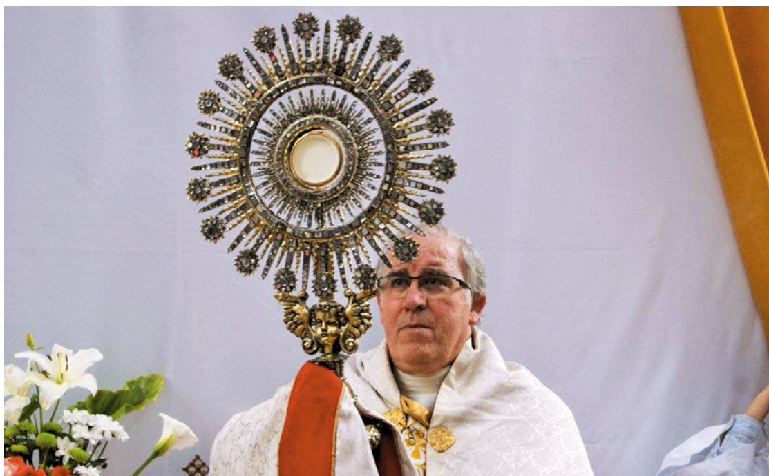
Celebració del Corpus Christi, 2018

Avui celebrem la festa del Corpus Christi. Enguany, degut a la crisi del coronavirus i les greus conseqüències que ha provocat, la celebració serà diferent. No serà possible recórrer els carrers dels nostres pobles i ciutats i contemplar els altars i les catifes de flors que preparàvem cada any com una ofrena al Senyor. Serà diferent, però hem d'aconseguir que sigui molt especial posant-hi intensitat i profunditat, per a rebre tot el fruit que el Senyor ens vol concedir, que sens dubte serà abundant. També hem d'escoltar amb atenció la invitació a la caritat, a compartir els nostres béns, i al compromís ferm per la pau i la justícia en el món.