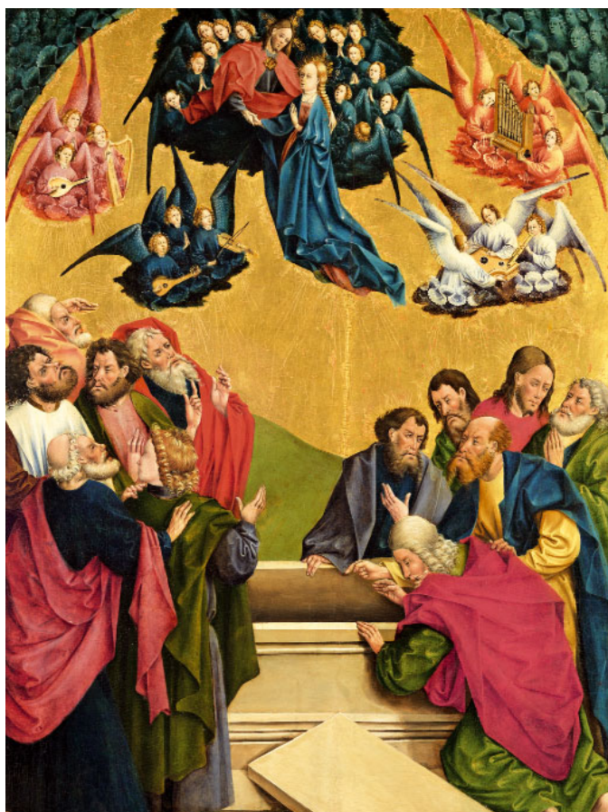
Assumpció de la Mare de Déu (s. XV), de Johann Koerbecke. Museu Nacional Thyssen-Bornemisza, Madrid

En segon lloc, Maria és introduïda en el misteri de Crist des del moment de l'anunciació i serà model de pelegrinatge de la fe. En primer terme, quan es dirigeix amb decisió a visitar la seva cosina Elisabet; a la Nativitat, tot mostrant als pastors i als Mags el seu