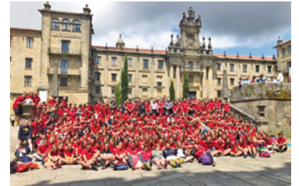
Pelegrinatge a Santiago, 2019

Pelegrinatge de joves. Entre els dies 27 de juliol i 2 d'agost tindrà lloc el pelegrinatge diocesà de joves. Enguany es farà de manera virtual. Cada dia els joves rebran a través de les xarxes els materials per treba-