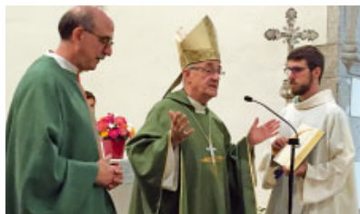
Parròquia de Sant Esteve del Coll

Dissabte 26 (al Casal Borja de Sant Cugat) i diumenge 27 (a Terrassa). VIII Jornades Transmet!