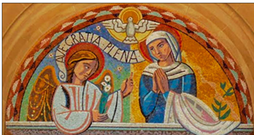
Mosaic de l'Anunciació Santuari de la Mare de Déu de la Salut Sabadell

El nostre Nadal serà diferent enguany; no n'hi ha dubte. Quan escric aquestes ratlles acaben d'arribar les últimes normatives del Govern. El Consell Interterritorial ha acordat tot un conjunt de mesures