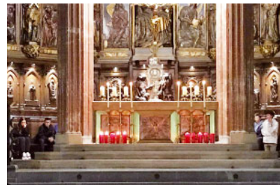
24 hores per al Senyor a la Catedral

24 hores per al Senyor. La nit del 29 al 30 de març, moltes esglésies de la diòcesi estigueren obertes per a la pregària, l'adoració i el sagrament de la re-