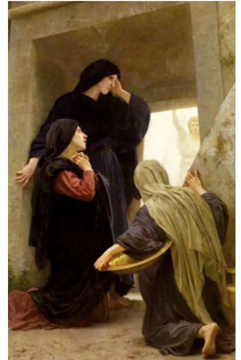
Dones santes en el sepulcre (1890) de William-Adolphe Bouguereau

El protagonisme que sant Lluç ha donat a les dones en aquesta escena essencial de la vida de Crist no l'ha pas produït ell, l'ha heretat de la Tradició apostòlica mateixa, dels testimonis oculars que han viscut en primera persona l'esdeveniment que ha canviat el ritme del món.