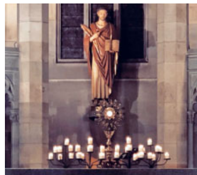
24 hores per al Senyor a Sant Feliu de Sabadell

conciliació seguint, un any més, la invitació del Papa Francesc.