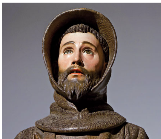
Sant Francesc d'Assís (1182-1226)

Us saludo des de Bolonya (Itàlia) on prego per vosaltres. Aquesta nit emprendrem el viatge de retorn a casa. En el nostre pelegrinatge diocesà hem viscut dos moments particularment significatius: la celebració de la Santa Missa d'avui, a la basílica de Sant Domènec, a Bolonya, al costat de la seva tomba; i divendres passat, la celebració vora la tomba de sant Francesc d'Assís a la basílica que duu el seu nom. Han estat uns moments de pregària especial per la nostra diòcesi al començament del nou curs. Recordem avui alguns trets de la vida d'aquests dos grans sants.