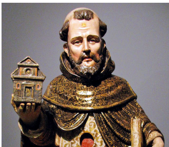
Sant Domènec de Guzman (1170-1221)

Sant Francesc d'Assís (1182-1226) va viure una joventut despreocupada, conreant els ideals cavallerescos del seu temps. Als vint anys participà en una campanya militar i va ser fet presoner. Es va posar malalt, fou alliberat, i en tornar a Assís va començar un procés de conversió espiritual que el portà a un canvi radical del seu estil de vida. En aques-