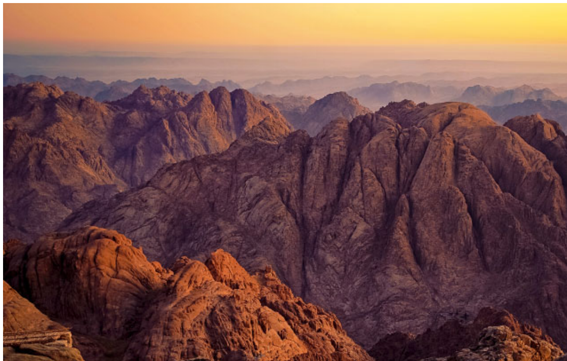
Capvespre al Mont Sinai o muntanya de l'Horeb

En el nostre itinerari quaresmal cap a la Pasqua, la Litúrgia de la Paraula de la Missa ens parla avui de la conversió com la millor actitud per a assumir la precarietat de l'existència humana i les adversitats que se'n presenten al llarg del camí. Avui contemplem la figura de Moisès, que tot pasturant pel desert el ramat del seu sogre Jetró arriba fins a la muntanya de l'Horeb i es fixa en una bardissa que cremava sense consumir-se. S'acosta per a observar aquest fenomen extraordinari i aleshores el Senyor el crida i li mana que es descalci perquè aquell lloc és terreny sagrat. Després li encarrega la missió d'alliberar el seu poble de l'esclavatge d'Egipte i de guiar-lo fins a la terra promesa. Aquest gest de descalçar-se és un acte d'humilitat i de respecte davant la presència de Déu, davant del misteri que el sobrepassa.