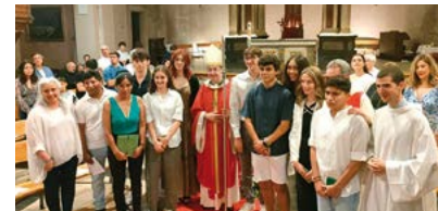
Confirmacions a La Garriga