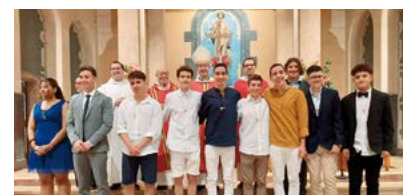
Confirmacions a Mollet