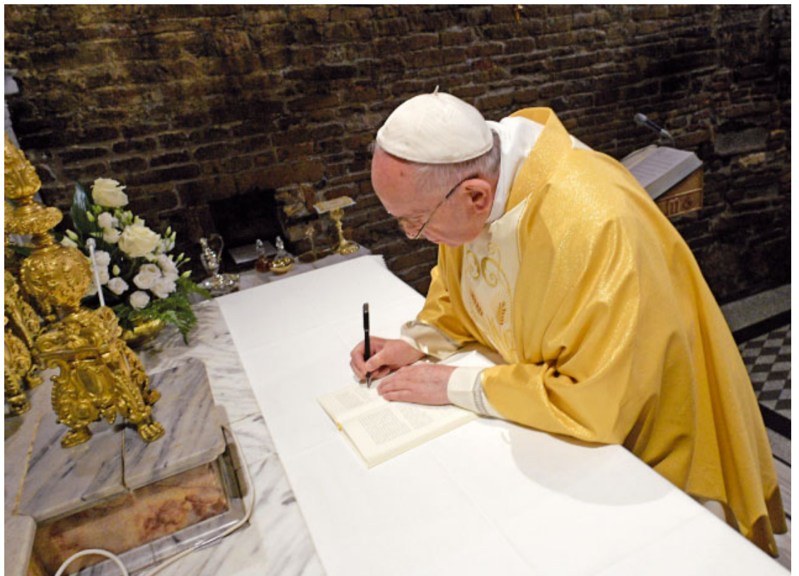
El papa Francesc signant l'exhortació apostòlica Christus vivit a Loreto

En el moment de l'anunciació, Maria inicia un camí de fe i d'unió amb el seu Fill que mantindrà fins al final, acompanyant-lo en totes les circumstàncies, especialment en el seu dolor. La prova més dura tindrà lloc al Calvari; allà, tot i el sofriment, quan el seu cor