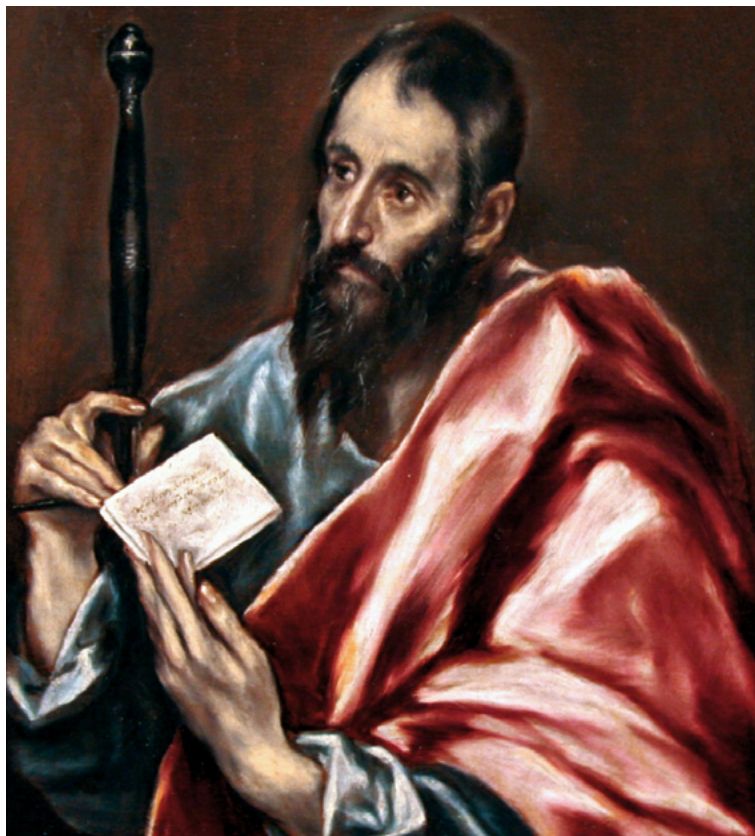
Sant Pau, el Greco. Museu d'Art de Sant Lluís (EUA)

El text fa referència a la seva total disponibilitat i adaptació a les diferents circumstàncies que li ha tocat de viure. I això ho fa no per un pur autocontrol, com els filòsofs estoics de la seva època, sinó per a predicar l'evangeli. Esdevé un bon exemple de com el cristià no s'ha d'instalar en la comoditat, no s'ha d'acomodar a una forma determinada de vida, ni tampoc distreure's amb els miratges del