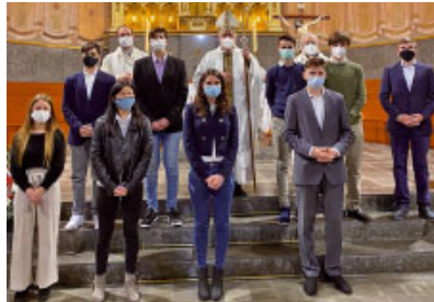
munitat parroquial de Santa Maria de Cardedeu.

Confirmacions a Cardedeu. El dissabte 14 de novembre, Mons. Saiz Meneses ha confirmat 9 joves de la co-