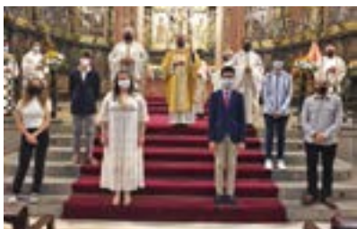
Confirmacions de la parròquia del Sant Esperit. El diumenge 16 de maig,

Mons. Saiz Meneses celebrà la Missa a la Catedral i confirmà 5 adolescents i 1 adult de la parròquia del Sant Esperit de Terrassa i d'altres llocs.