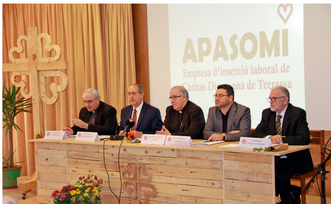
Acte de presentació d'APASOMI S.L.U. la nova empresa d'inserció promoguda per Càritas Diocesana de Terrassa, el 22 de maig de 2015

Hi ha moments de la vida en els que ens preguntem: què és l'ésser humà? Trobem respostes en la mitologia, la filosofia, la sociologia, la literatura, la medicina, la psicologia, la religió, etc. De les respostes en deriven les més variades antropologies, és a dir, diferents concepcions d'allò que és l'ésser humà. La nostra antropologia es fonamenta en la revelació cristiana, que ens presenta el disseny d'amor de Déu i ens ensenya que l'ésser humà ha estat creat «a imatge de Déu», amb capacitat de conèixer i estimar el seu Creador. També ens ensenya que Déu ha constituït l'ésser humà senyor de tota la creació i que l'ha d'ordenar per a glòria de Déu i per al seu propi perfeccionament (cf. Gn 1,28).