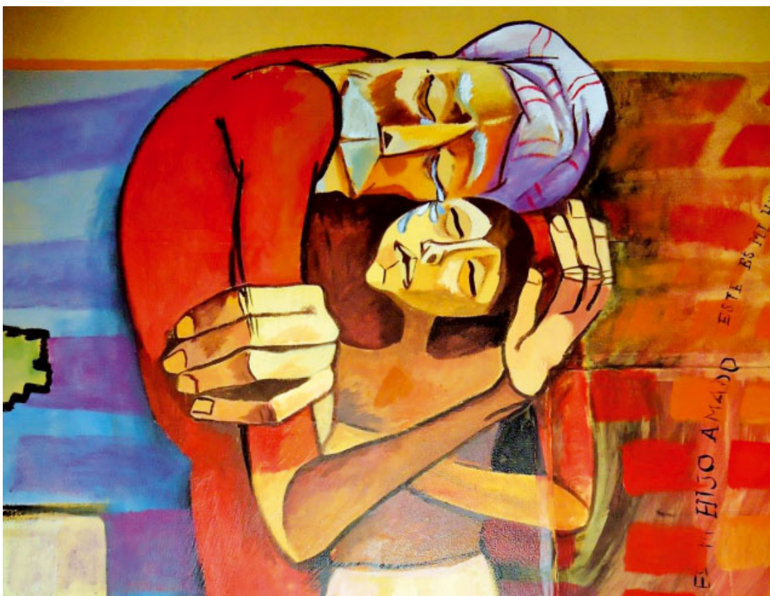
El retorn del fill pròdig (2010), Gna. Francis Robles, capella del Monestir de la Conversió de Becerri de Campos (Palència)

Posar-se en camí i tornar a la casa del pare. Podem trobar persones que es troben enfonsades en la misèria, dilapidant o destruint la pròpia vida; d'altres potser caminen en una mala direcció i quan més caminen més s'allunyen de la font de la veritat i del bé; també d'altres poden estar orientats en la bona direcció, però per diferents motius, es queden aturats o caminen massa poc a poc. El temps de Quaresma és un temps propici per a examinar la pròpia existència a la llum de la Paraula de Déu, i preguntar-se amb valentia si s'està satisfet