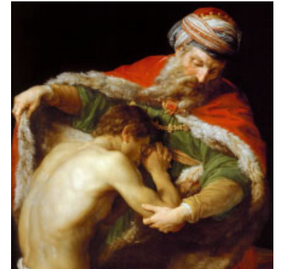
El retorn del fill pròdig (1773) de Pompeo Batoni. Museu d'Història de l'Art de Viena (Àustria)

Com no hauríem de detenir-nos en l'evangeli d'avui! Sant Lluc ens proposa una paràbola en tres relats, un relat en tres paràboles. Totes tenen com a centre l'alegria per la troballa de quelcom que un personatge havia perdut: l'ovella, la monedeta, el fill díscol i tarabana . Les paraules de Crist són una font d'inspiració per a la nostra vida espiritual que ens generen una espiritualitat de conversió a Déu Pare, i que podem identificar en cinc passos.