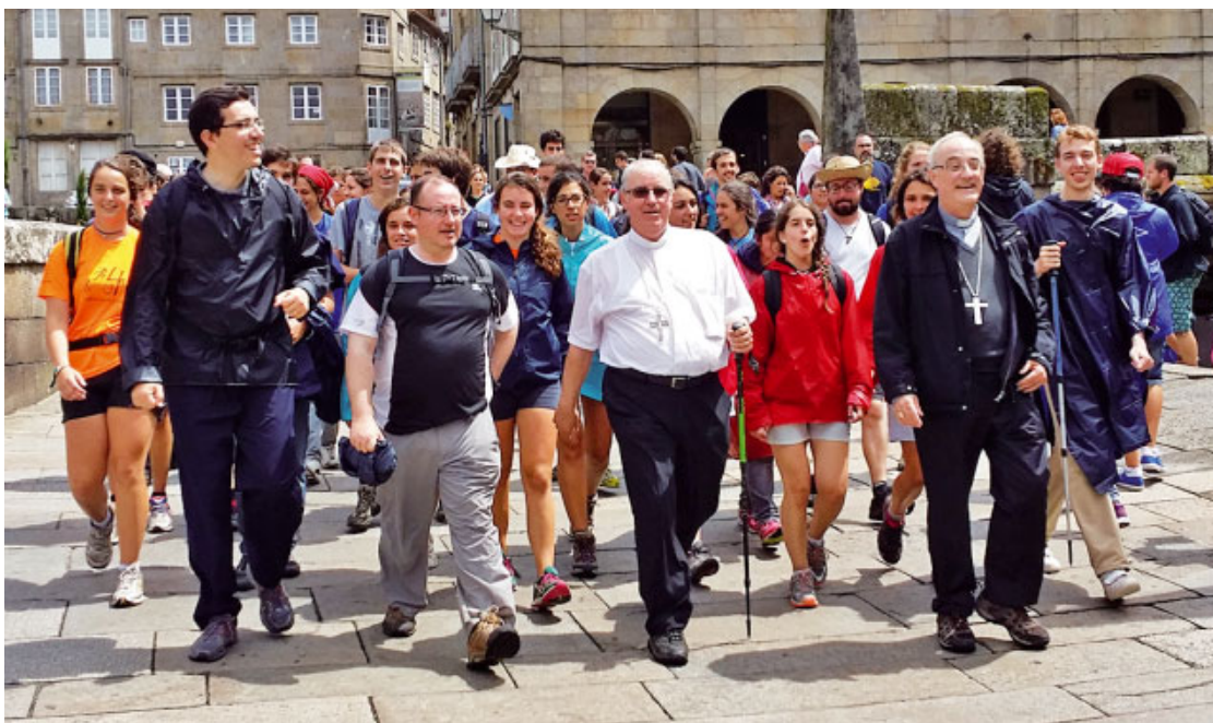
El Sr. Bisbe i el Sr. Bisbe auxiliar amb joves arribant a Santiago de Compostel·la (2014)

Del 21 al 28 del juliol passat va tenir lloc el Sisè Pelegrinatge Diocesà de Joves, que aquesta vegada va consistir en recórrer la part del Camí que va des de Finisterre a la capital compostel·lana. Passats cinc anys hem tornat a fer una part del Camí de Santiago. Vull recordar que vàrem començar aquests pelegrinatges l'any 2014, i el primer va ser del 28 de juliol al 4 d'agost, en aquella ocasió des de Lugo fins a Santiago. L'any següent vàrem pelegrinar a Àvila, i entre els dies 5 i 9 d'agost vàrem participar en l'Encontre Europeu de Joves, organitzat per la Conferència Episcopal espanyola, amb el lema «En temps durs, amics forts de Déu»; un encontre que va tenir lloc en el marc de les celebracions del V Centenari del naixement de santa Teresa de Jesús.