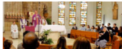
Missa per TV2