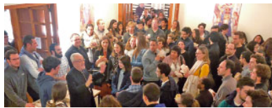
Jornada de Portes Obertes