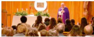
Vetlla de Pregària per les Vocacions