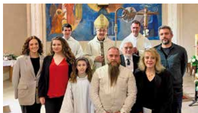
Confirmacions a Bigues