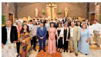
Confirmacions al Sagrat Cor de Sabadell

tes parròquies: dissabte 22 d'abril, Sant Salvador de Polinyà (7 joves); diumenge 23, Sant Pere i Sant Pau de Bigues (3 persones); Sagrat Cor de Sabadell (38 persones entre joves i adults).