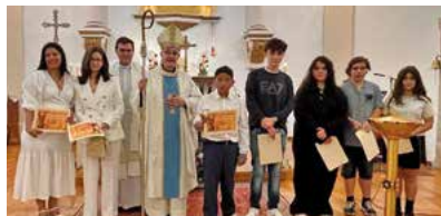
Confirmacions a Polinyà

Confirmacions. Mons. Cristau ha celebrat l'Eucaristia i ha administrat el sacrament de la Confirmació a aques-