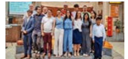
Parròquia de la Puríssima de Sabadell (22/07/2024)