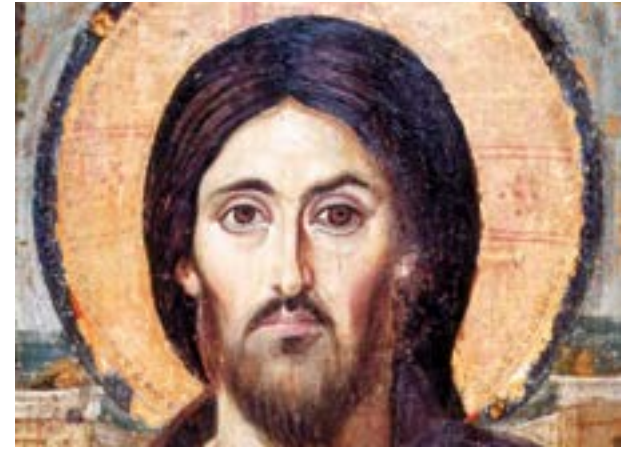
Icona del Crist Pantocràtor, s. VI. Monestir de Santa Caterina. Mont del Sinai (Egipte)