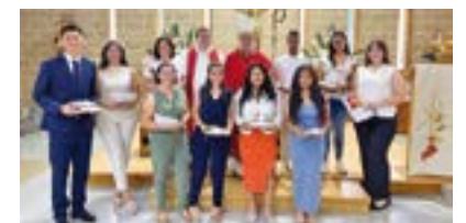
Parròquia de Sant Antoni de Pàdua (23/07/2024)

Fe d'errates. En el Full Dominical anterior es deia que les confirmacions a la parròquia de Santa Engràcia de Montcada i Reixac eren el diumenge 7 de juny, en comptes del diumenge 7 de juliol. Disculpeu l'errada.