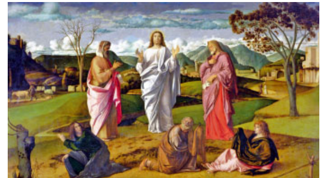
Transfiguració de Crist (1487), de Giovanni Bellini. Museu de Capodimonte, Nàpols (Itàlia)