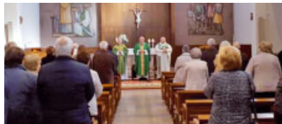
Sant Joaquim de Martorelles

a ambdós temples. Durant la setmana duagué a terme la Visita Pastoral.