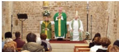
Santa Maria de Martorelles