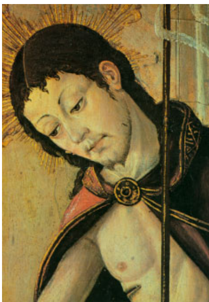
Faç de Jesucrist. Pintura de Rodrigo d'Osona, Museu Provincial de València

En aquel tiempo, dijo Jesús a sus discípulos: «Como el Padre me ha amado, así os he amado yo; permaneced en mi amor. Si guardáis mis mandamientos, permaneceréis en mi amor; lo mismo que yo he guardado los mandamientos de mi Padre y permanezco en su amor. Os he hablado de esto para que mi alegría esté en vosotros, y vuestra alegría llegue a plenitud. Este es mi mandamiento: que os améis unos a otros como yo os he amado. Nadie tiene amor más grande que el que da la vida por sus amigos. Vosotros sois mis amigos, si hacéis lo que yo os mando. Ya no os llamo siervos, porque el siervo no sabe lo que hace su señor: a vosotros os llamo amigos, porque todo lo que he oído a mi Padre os lo he dado a conocer. No sois vosotros los que me habéis elegido, soy yo quien os he elegido y os he destinado para que vayáis y deis fruto, y vuestro fruto dure. De modo que lo que pidáis al Padre en mi nombre os lo dé. Esto os mando: que os améis unos a otros.»