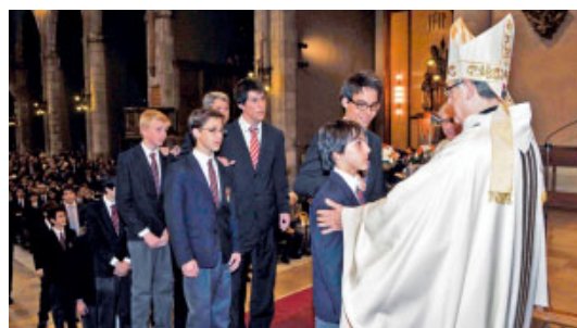
Confirmacions del col·legi Viaró

Confirmacions a la Catedral. El dimecres dia 2 de maig, a les 17.30 h, Mons. Salvador Cristau, bisbe auxiliar, va presidir la Missa a la Catedral i va administrar el sagrament de la Confirmació a 87 alumnes del col·legi Viaró de Sant Cugat del Vallès. El dijous dia 3 va confirmar 107 alumnes del col·legi la Farga de Bellaterra.