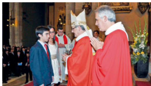
Confirmacions del col·legi La Farga