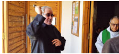
Visita a la parròquia de St. Antoni de Pàdua

Diumenge 1 de març, a les 12 h. Celebra l'Eucaristia a la Catedral amb el ritu d'Elecció dels catecúmens.