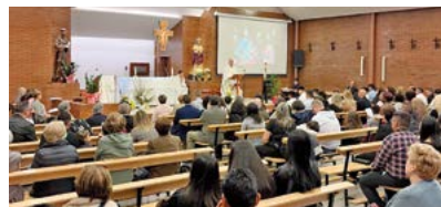
Sant Francesc d'Assís de Sabadell