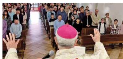
Sant Genís de Plegamans

Cap de setmana de confirmacions. El cap de setmana passat el Sr. Bisbe va presidir diverses confirmacions. El dissabte 6 d'abril, a la parròquia de Sant Francesc d'Assís de Sabadell, va