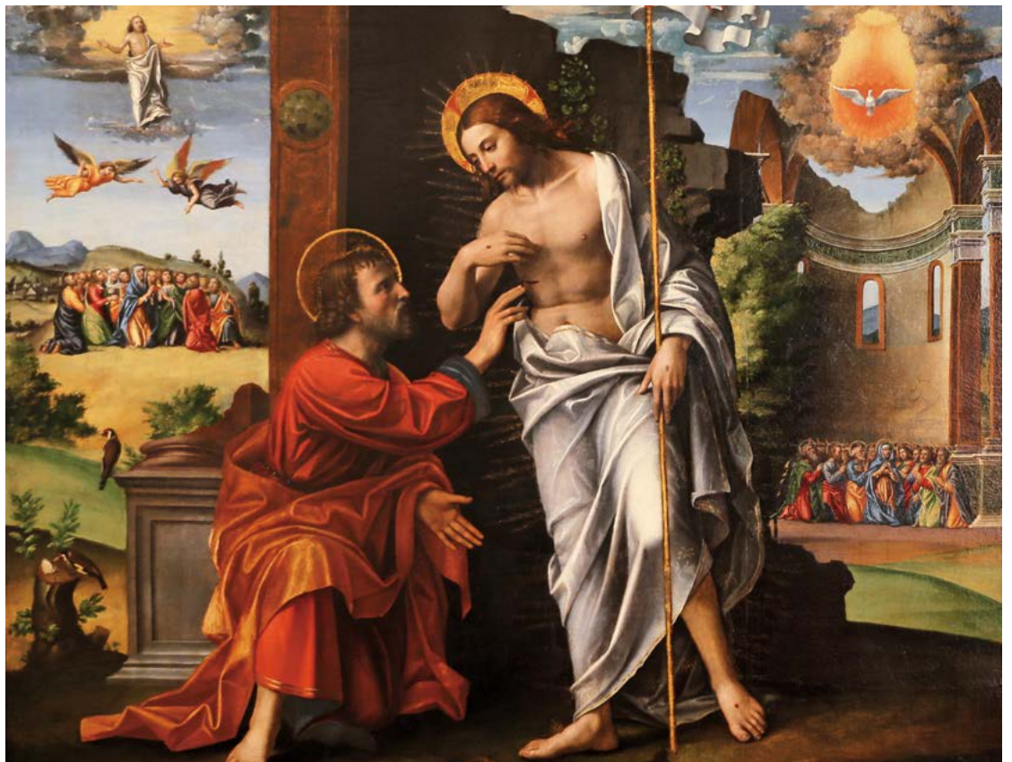
La incredulitat de sant Tomàs (1520), de Paolo Morando Cavazzola. Museu de Castelvecchio, Verona (Itàlia)

Però, i nosaltres?, ens hem trobat amb Jesús a la nostra vida? Hem tingut aquesta experiència? I no em refereixo a veure'l físicament. Perquè si no és així, si Ell no és present a la nostra vida, vol dir que a aquesta vida li falta un element fonamental. I, a més, ens mancaran també la joia i l'esperança veritables.