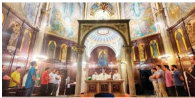
El Seminari en el Santuari de la Salut. El dimarts 13 de setembre, el Seminari

de Terrassa, seguint un costum, va anar al Santuari diocesà de la Mare de Déu de la Salut, a Sabadell, per posar als peus de la Mare de Déu el nou curs pastoral que acaba d'iniciar.