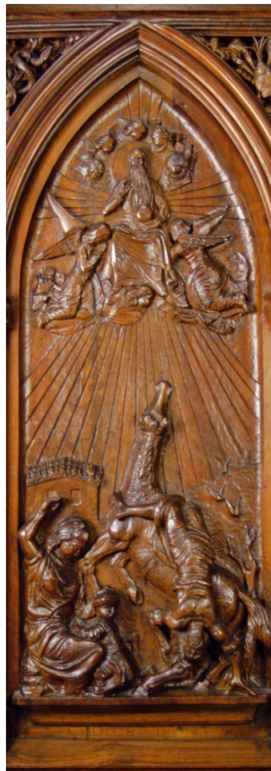
Sant Pau caient del cavall, imatge del cadiram de la Catedral de Terrassa

Sant Pau serà el missatger de la universalitat de la salvació, anunciarà que totes les persones estan cridades a la salvació, sense diferències, sense exclusivismes. Tal com diu als cristians de Galàcia, «ja no compta ser jueu o grec, esclau o lliure, home o dona. Tots sou una sola cosa en Jesucrist» ( Ga 3,28 ). La salvació no està en funció de la pertinença a un poble, ni tan sols en funció de l'observança d'una llei. Déu ha intervingut en la història mitjançant l'enviament del seu Fill, que pel seu misteri pasqual salva la humanitat. Al mateix temps, l'apòstol Pau va saber acollir els valors positius de la filosofia del seu temps, amb una mirada positiva, inclusiva, tal com ho recomana a la comunitat de Filipis: «Finalment, germans, interesseu-vos per tot allò que és veritat, respectable, just, net, amable, de bona reputació, virtuós i digne d'elogi» ( Fl 4,8 ).