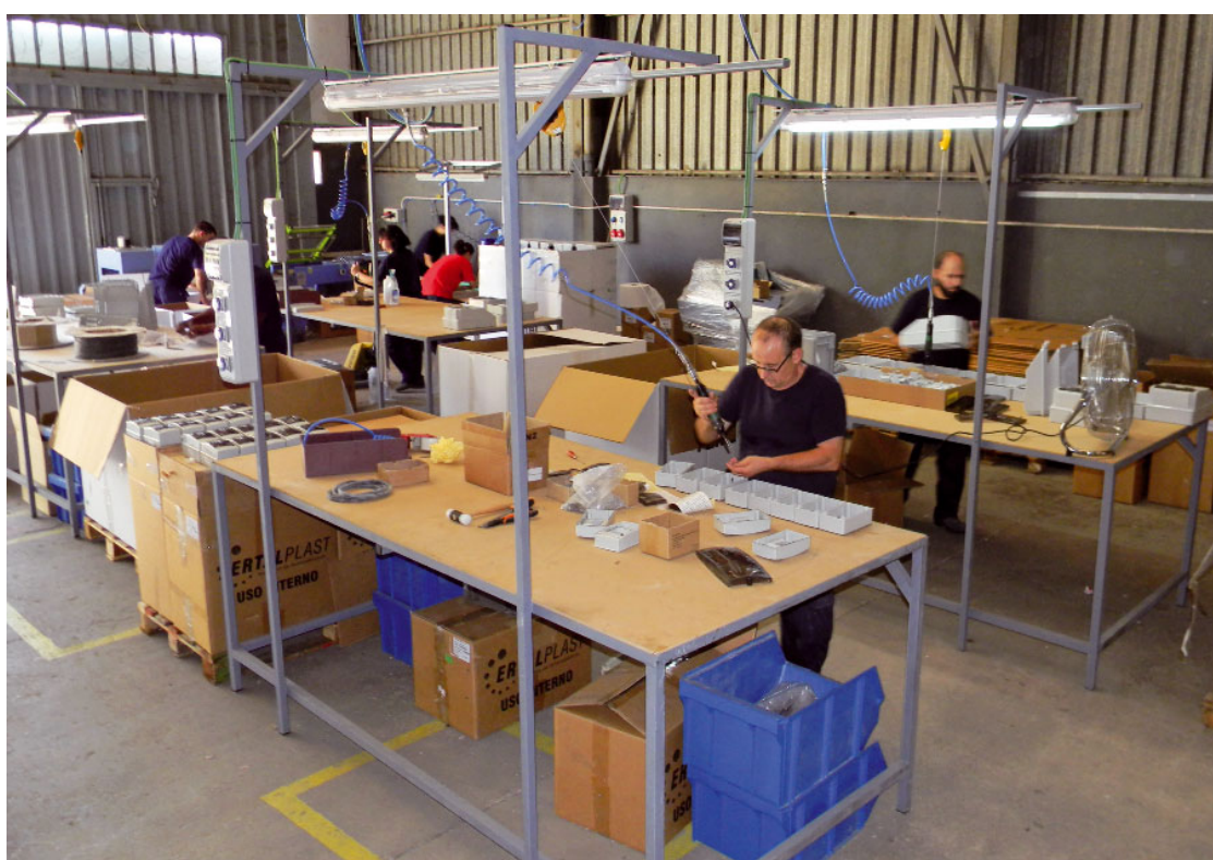
Treballadors d'APASOMI, empresa d'inserció laboral de Càritas Diocesana de Terrassa