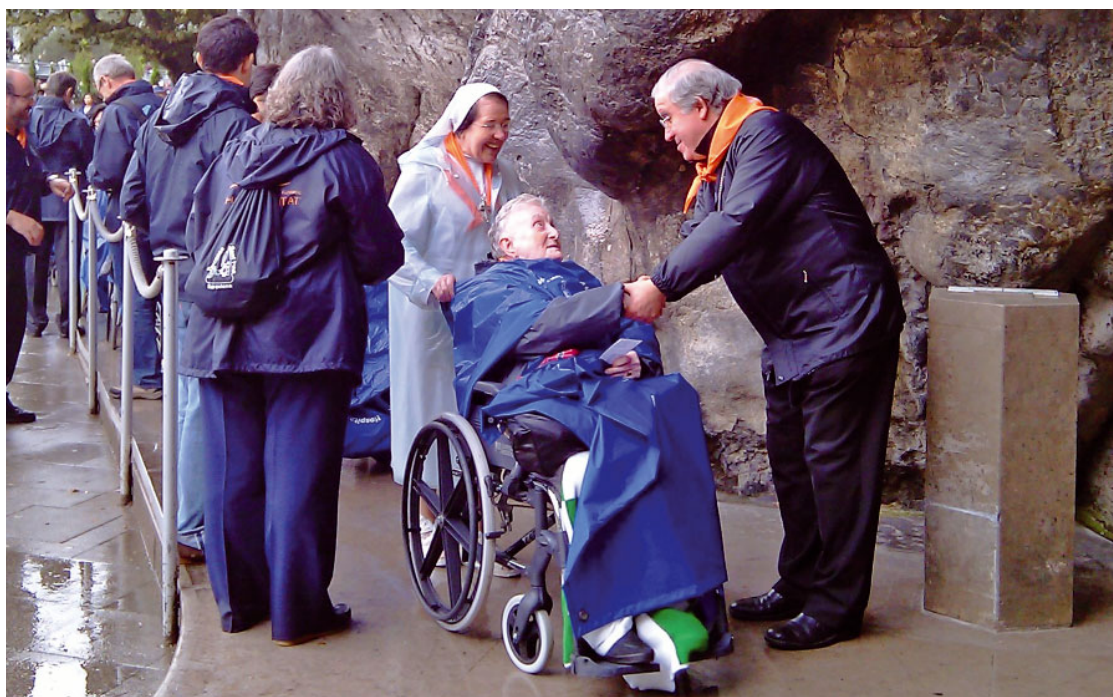
Pelegrinatge a Lourdes, 25 de setembre de 2010

En aquests moments surt la pregunta pel sentit de la vida i de les coses, i necessitem amb urgència respostes als nostres perquè. La figura de Job il·lumina les nostres vides en aquestes situacions. En un moment determinat ho perd tot: familiars, béns, amics, salut. Sembla que Déu l'abandona, en un silenci total. Amb tot, Job parla amb Déu, li crida; i en la seva pregària, malgrat tot, conserva la seva fe i, al final, descobrirà el valor de la seva experiència i del silenci de Déu. Finalment, Déu li respon, li obre un nou horitzó molt més ampli. S'adona que el seu sofriment