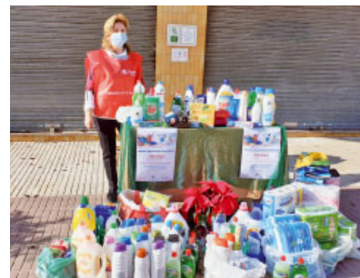
La Roca del Vallès

A la Roca del Vallès la implicació dels veïns fa possible el repartiment de productes d'higiene personal.