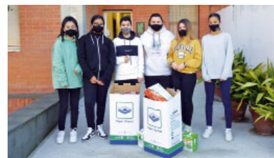
Institut Jaume Cabré de Terrassa

Col·laboració amb Càritas. La campanya de col·laboració amb Càritas dels alumnes d'ESO de l'Institut Jaume Cabré de Terrassa dona esperança a les persones més vulnerables.