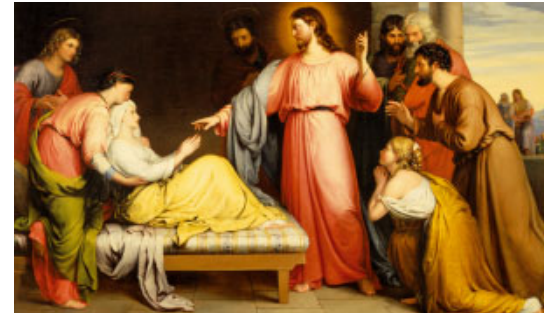
La curació de la sogra de Pere (1839), de John Bridges. Museu d'Art de Birmingham (Anglaterra)