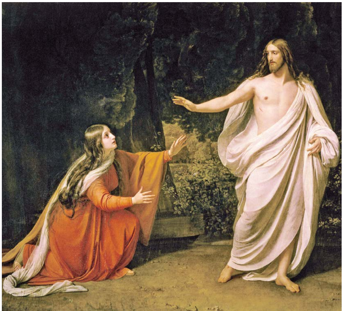
Aparició de Jesucrist a Maria Magdalena (1835), d'Alexander A. Ivanov. Museu Rus, Sant Petersburg (Rússia)

Per tant, avui és un dia per lloar i felicitar Déu, per donar-li gràcies pel seu amor i la seva misericòrdia. És un dia per renovar la fe i el compromís amb Crist, el que vàrem fer en rebre el baptisme. I per com-