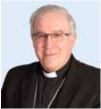
† Josep Àngel Saiz Meneses Bisbe de Terrassa